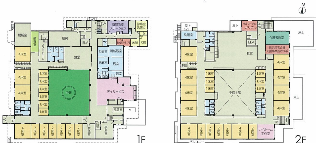
特別養護老人ホーム：定員80名 ショートステイ：定員10名